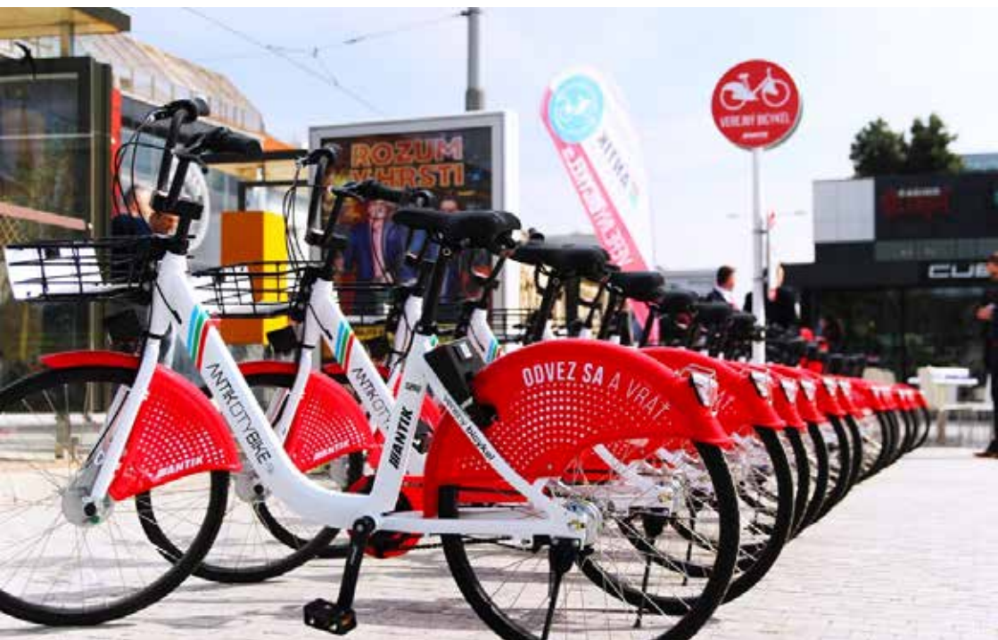
Zdieľané bicykle, Zdroj: ANTIK Telecom s.r.o. & Antik Technology,