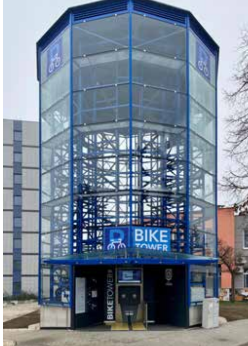
Cykloveža v Trnave, zdroj: mesto Trnava, www.trnava.sk