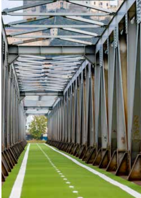
Cyklomost v Trenčíne, zdroj: Patrik Žák, mesto Trenčín