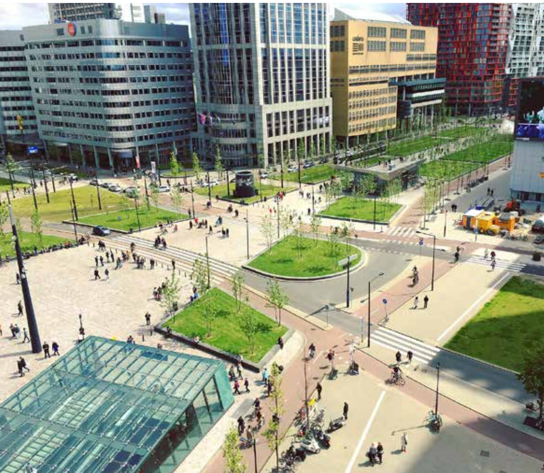
Verejný priestor s prevahou udržateľných foriem mobility

Keď ide o rozvoj mestskej oblasti, plán udržateľnej mestskej mobility je kľúčovým dokumentom. Oplatí sa usilovať o zavedenie mechanizmu na zabezpečenie jeho všeobecnej odbornej kvality. Osobitnú pozornosť si počas vykonávania plánu vyžaduje zabezpečenie kvality údajov a riadenia rizík. Týmito úlohami možno poveriť externých kontrolórov kvality alebo inú inštitúciu verejnej správy.