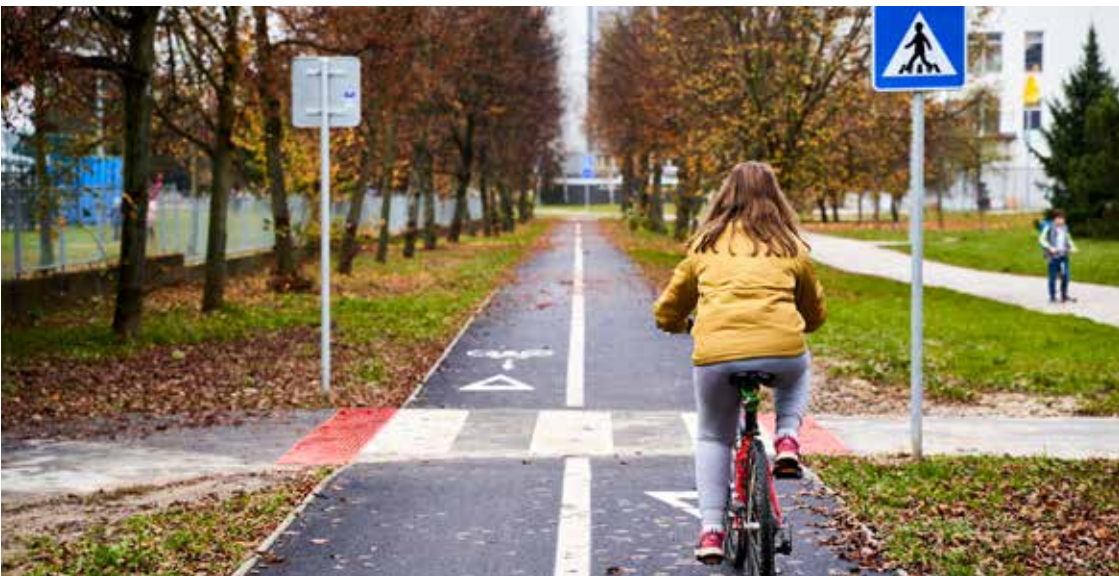
Vybudovaná cyklotrasa v Žiline