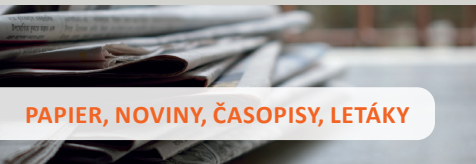
PAPIER, NOVINY, ČASOPISY, LETÁKY