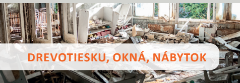
DREVOTIESKU, OKNÁ, NÁBYTKO